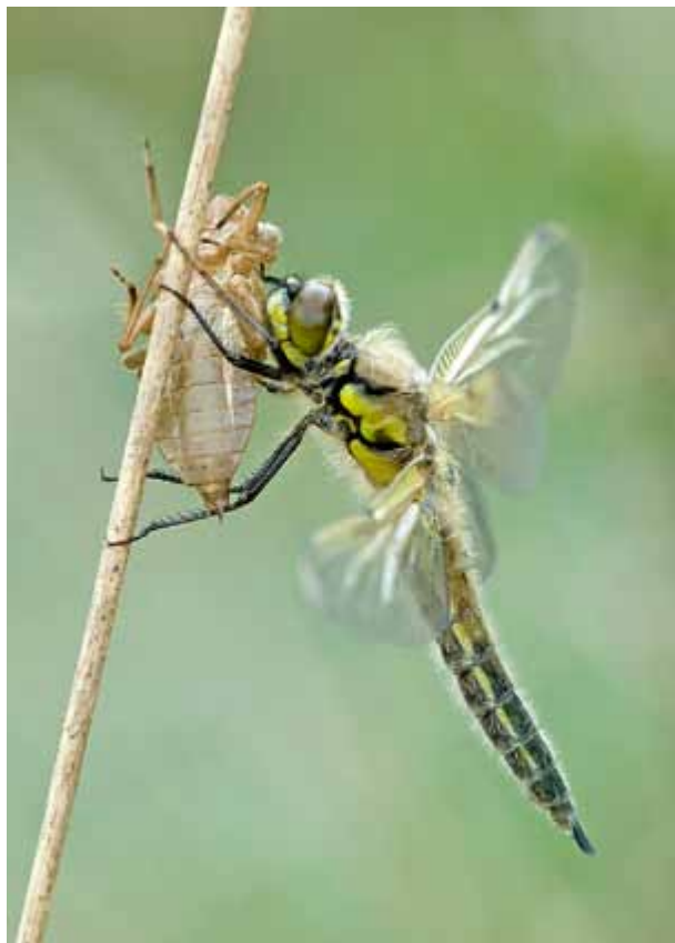
Libelle mit Schlupfhaut, siehe Workshop: „Genaueres Hinsehen lohnt sich“.