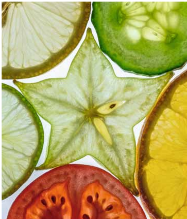
Obstscheiben mit Durchlicht, siehe Workshop: „Durch die Frucht geschaut“.