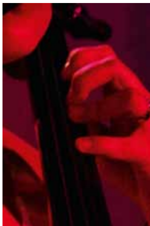
Vergrößerter Ausschnitt des Bildes.

neueren Modellen wird das Bildrauschen erst ab wesentlich höheren ISO-Werten stärker sichtbar.