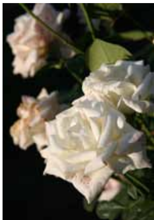
Mit einer halb so langen Verschlusszeit von 1/200 s ist das Foto richtig belichtet.