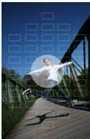
Messbereich bei der Selektivmessmethode.

Bei der Selektiv- oder Spotmessung wird nur ein sehr geringer Teil des Bildes zur Messung herangezogen und der restliche Bereich hat keinen Einfluss auf die Berechnung (bei der Selektivmessung ca. 10 %, bei der Spotmes-