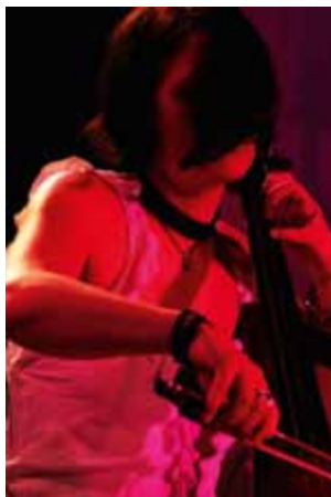
Foto mit starkem Bildrauschen bei hohem ISO-Wert.