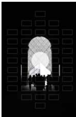
Messbereich bei der Spotmessmethode.