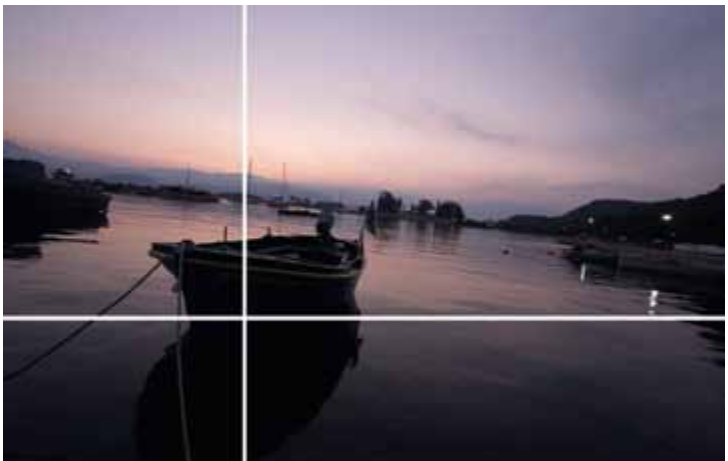
Ausrichtung des Motivs an Linien und Schnittpunkt.

Bedenken Sie, dass diese Regel kein Dogma darstellt und je nach Bildidee auch gebrochen werden kann.