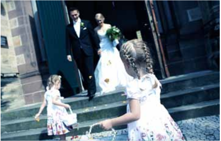
Aufnahme vor der Kirche, weiterhin mit Kunstlicheinstellung: Die Farben werden bläulich dargestellt.

Ein Beispiel: Sie fotografieren ein Brautpaar auf dem Standesamt zuerst drinnen (mit entsprechenden Weißabgleich auf Kunstlicht) und müssen dann ganz schnell nach draußen eilen, um den Empfang des Paares vor der Tür festzuhalten. Da kann es sehr leicht passieren, dass Sie in der Hektik erst viel zu spät bemerken, dass der Weißabgleich noch auf Kunstlicht eingestellt ist.