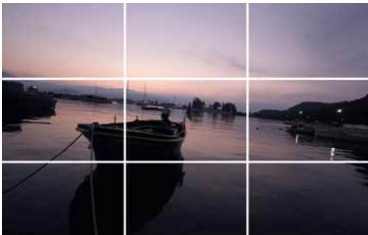
Raster zur Verdeutlichung der Dritteinteilung.

Entsprechend dieser Regel teilen Sie das Bild gedanklich in neun gleichgroße Teile, indem Sie je zwei Linien waagrecht und senkrecht ziehen und Ihr Motiv an diesen Linien oder einem der vier Schnittpunkte ausrichten.