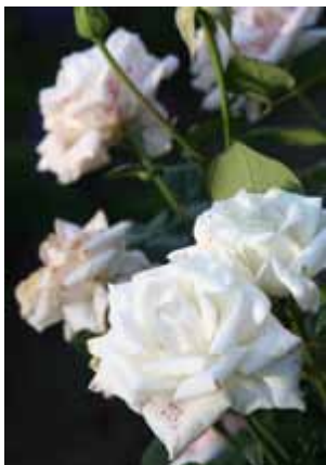
Mit einer Verschlusszeit von 1/100 s ist das Foto überbelichtet.

Über die Verschlusszeit, auch Belichtungszeit genannt, entscheiden Sie, wie lange Licht durch das Objektiv auf den Bildsensor der Kamera trifft. Damit, vereinfacht gesagt, bestimmen Sie, wie hell oder dunkel ein Bild wird. Bei einer längeren Verschlusszeit gelangt mehr Licht auf den Sensor. Das ist bei dunklen Lichtsituationen (z. B. in Innenräumen) durchaus von Vorteil. Doch je länger Sie belichten, desto größer ist auch die Gefahr, dass das Bild verwackelt. Und umgekehrt: Je kürzer die Verschlusszeit ist, desto wahr-