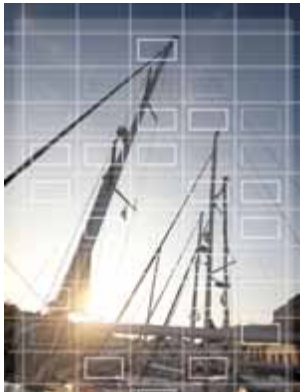
Messbereich bei der Mehrfeld- oder Matrixmessmethode.

Bei der Mehrfeld- oder auch Matrixmessung wird der gesamte Bildbereich für die Berechnung der optimalen Belichtung herangezogen. Diese Messmethode ist recht zuverlässig und deckt bereits eine große Zahl von Motivsituationen ab. Sie ist z. B. für Porträtfotos gut geeignet.