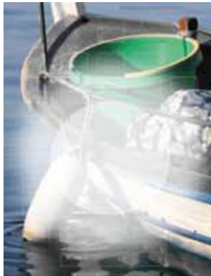
Messbereich bei der mittenbetonten (Integral-)Messmethode.