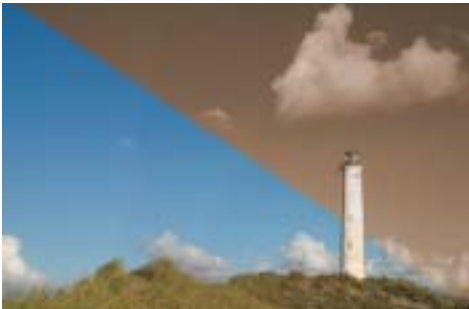
Das gleiche Bild, einmal in Farbe, einmal als monochrome Sepiaversion

Manche Kameras bieten die Möglichkeit, ein Digitalbild gleich in Schwarzweiß aufzunehmen – oder sogar direkt auf alt getrimmt in „Sepiatonung“.