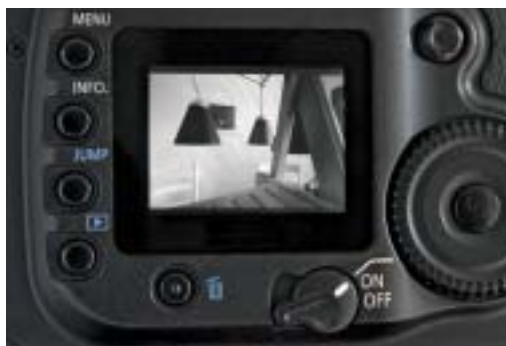
Die Schwarzweiß-Vorschau in Aktion

So können auch Farbkontraste, die bei der Standardumwandlung vielleicht unerwünscht zu einem einheitlichen Grau werden, doch noch in einen starken Helligkeitskontrast umgewandelt werden. Außerdem haben Sie, wenn Sie das Foto als Farbbild speichern, die Möglichkeit, es sich nachträglich anders zu überlegen und das Bild doch noch in Farbe zu nutzen.